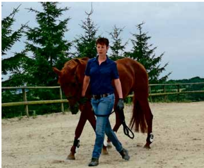
Führtraining bildet die Basis für Gelassenheits- und Geschicklichkeitstraining.

Zum Gelassenheitstraining zählen die Arbeit an einem langen Bodenarbeitsseil oder an einer drei bis fünf Meter kurzen Longe, das Führen durch Engpässe und unterschiedliche GHP-Hindernisse. Das Geschicklichkeitstraining beinhaltet das seitliche Verschieben des Pferdes, Arbeit in