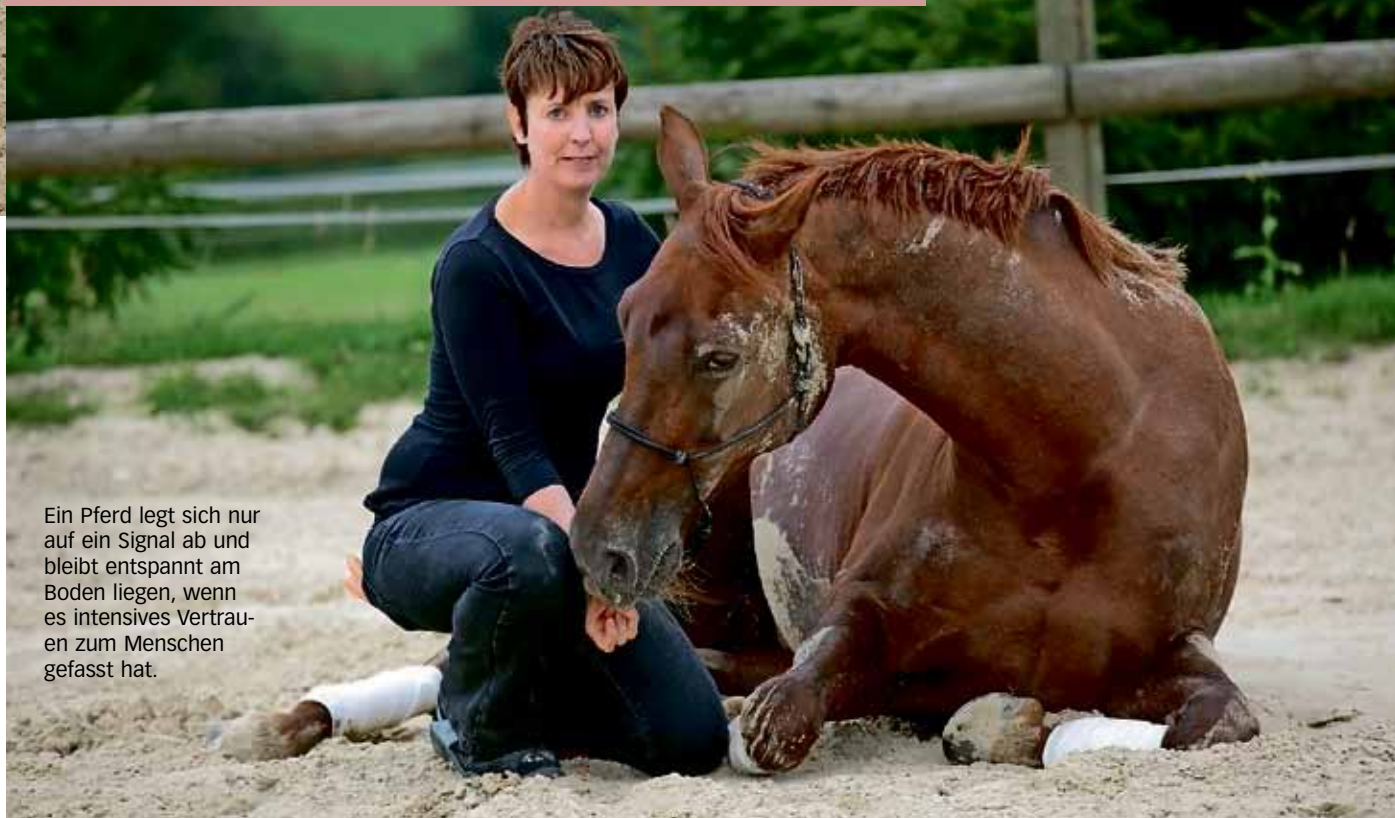
Ein Pferd legt sich nur auf ein Signal ab und bleibt entspannt am Boden liegen, wenn es intensives Vertrauen zum Menschen gefasst hat.

Der erste praktische Teil besteht aus dem Führtraining. Hier wird das präzise Führen des Pferdes von beiden Seiten